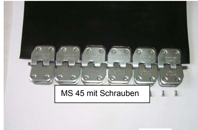
MS 45 mit Schrauben